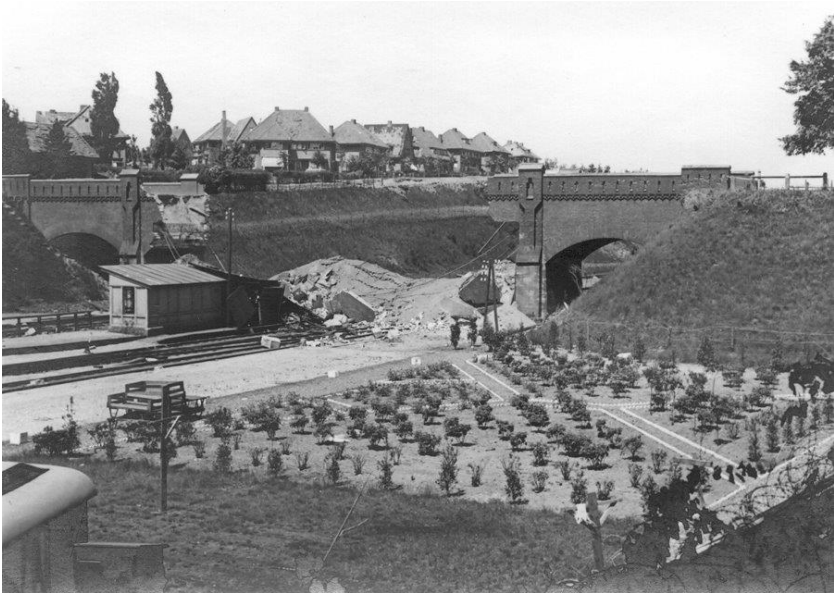
Het viaduct direct na de slag om de Grebbeberg

Toch besloot de Nederlandse legerleiding op de avond van de 12 e mei dat er zo spoedig mogelijk een tegenaanval moest komen om de Duitsers van de Grebbeberg af te jagen. Daartoe werden 4 bataljons bij het dorpje Achterberg verzameld en die zouden dan in zuidoostelijke richting optrekken, richting Grebbeberg. De aanval begon al onder een ongunstig gesternte. Veel van de soldaten waren al vanaf 11 mei vrijwel onafgebroken in touw en waren daarna veelal vanuit de Betuwe lopend naar Achterberg gekomen. Verder hadden ze nauwelijks landkaarten van de omgeving en waren ze niet getraind in het voorwaartse gevecht. Om 7:00 werd de aanval ingezet maar deze onttaarde al snel in chaos doordat de onderlinge verbanden verloren gingen. Ook wisten de Nederlandse troepen die zich al in de frontlinie bevonden helemaal van niets - alweer die slechte verbindingen -